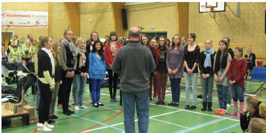
Voxpop til konkurrencen

re andre stemmer eller nye stemmer til nogle af korsatserne.